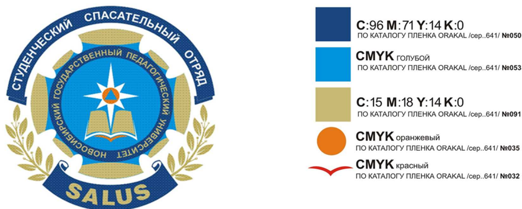
Рисунок 1 – Графическое изображение эмблемы

4.2 Графическое изображение эмблемы представлено на рисунке 1.